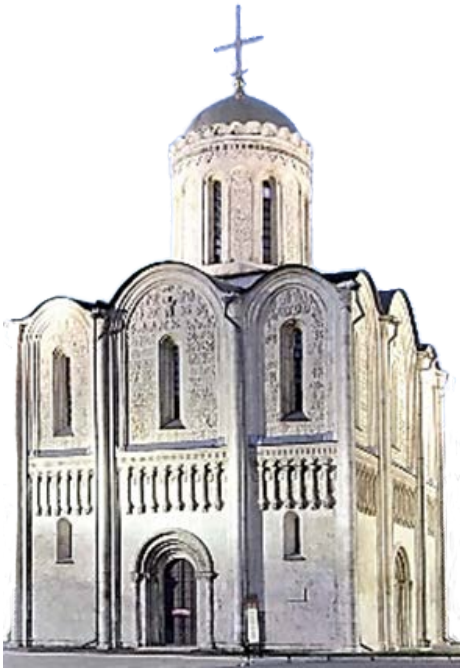
Храм Покрова на Нерли

В стремлении укрепить престиж своего княжества Андрей украсил свою столицу и крупнейшие города своих владений великолепными белокаменными соборами (Успенский собор и Золотые ворота во Владимире, церковь Рождества Богородицы в Боголюбове). Князя Владимирского впервые начали называть наравне с киевским «великим князем».