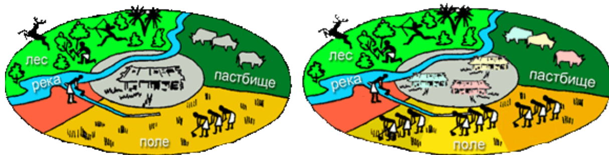
Рис. Схема организации трудовой деятельности в родовой (слева) и соседской (справа) общине (попробуйте сформулировать разницу).

В соседской общине люди постепенно забывали о своем общем когда-то родстве. Это не считалось главным. Теперь, как правило, работали не единым коллективом, хотя по-прежнему трудились добровольно и без принуждения. У каждой семьи в частной собственности была хижина с огородом, участок пашни, скот, орудия труда. Но общинная собственность сохранялась.